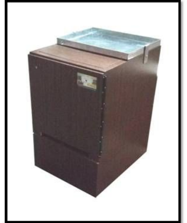
Model No: 004 B