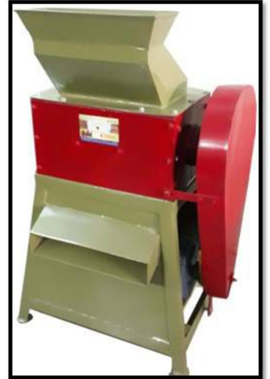
Model No: 005 B