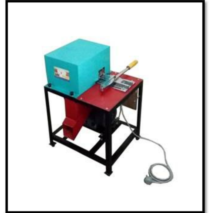
Model No: 008