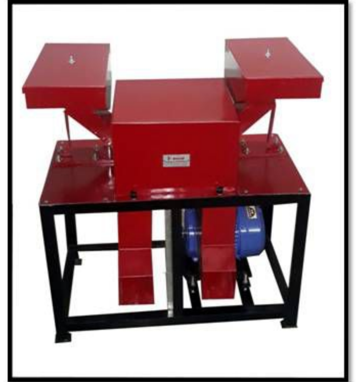
Model No: 009 A