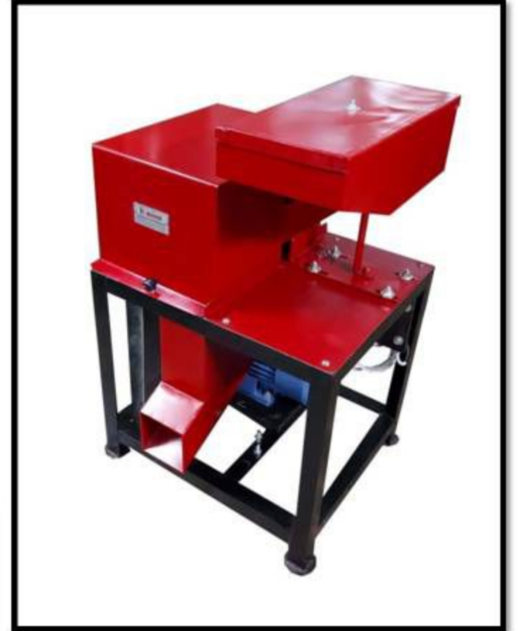
Model No: 009