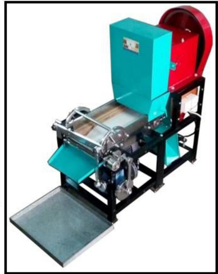
Model No: 006